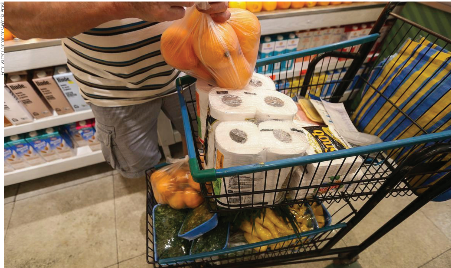
Números mostram maior consumo no primeiro trimestre

Segundo o vice-presidente da Abras, o primeiro trimestre do ano trouxe algum alívio para os consumidores, com menor pressão da inflação nos alimentos, diferente do que ocorreu no mesmo período do ano passado. "Naquele período houve escalada nos preços dos preços das principais commodities