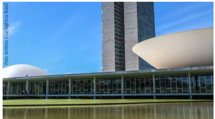
Lei 14.791 foi aprovada no Congresso Nacional no fim de 2023 e publicada na edição de terça-feira

"As despesas que forem realizadas no âmbito do Programa de Aceleração do Crescimento não serão computadas no cálculo do resultado primário, ou seja, ainda que com o PAC o resultado primário nominal não seja zero, ele não vai impactar no resultado