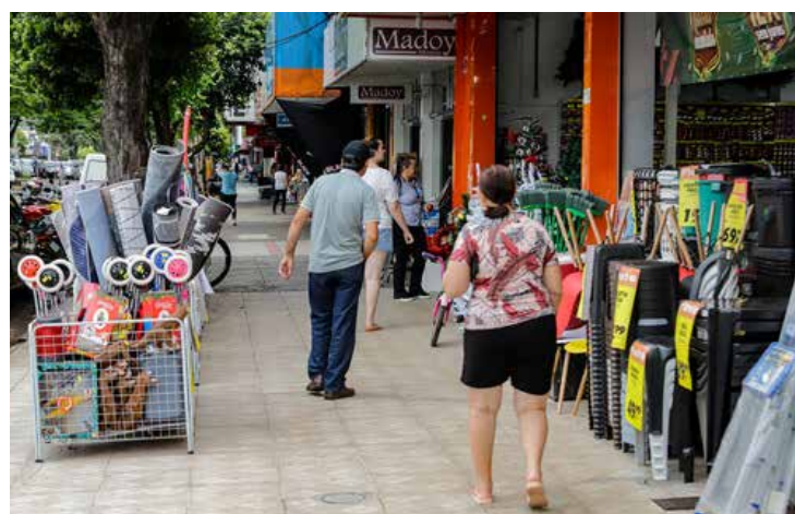
Processo de agilidade na abertura de empresas é algo fundamental para o bom funcionamento da economia

maior em comparação com os 227 do Piauí e os 339 de Sergipe, que são respectivamente 18,6 e 12,4 vezes menos do que o total avaliado pelo Paraná no mesmo período.