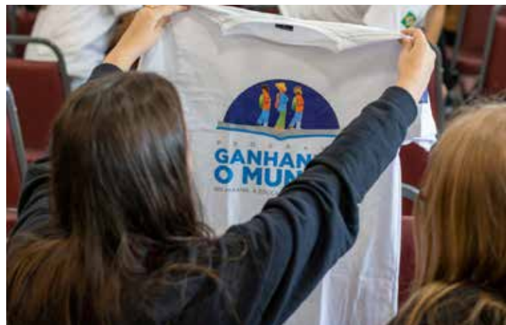
Mais de 12 mil alunos se inscreveram para esta fase do programa

Cadeias de montanhas rochosas, extensas florestas boreais e vastas planícies cobertas de gelo. Este é o cenário que aguarda os dez estudantes da rede estadual de ensino que, nesta quarta-feira (24), embarcaram rumo ao Canadá, onde permanecerão por um semestre letivo, imersos no programa de intercâmbio viabilizado pelo Ganhando o Mundo. Uma iniciativa do Governo do Estado, realizada por meio da Secretaria de Estado da Educação do Paraná (Seed-PR).