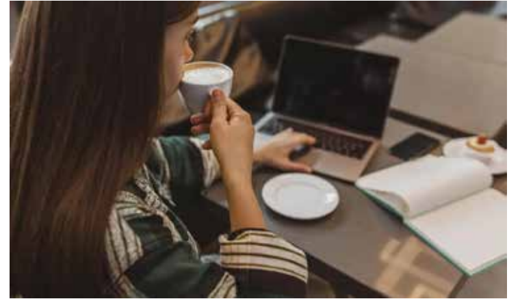
Consumidor consciente da informação poderá escolher se permanece ou não no estabelecimento.