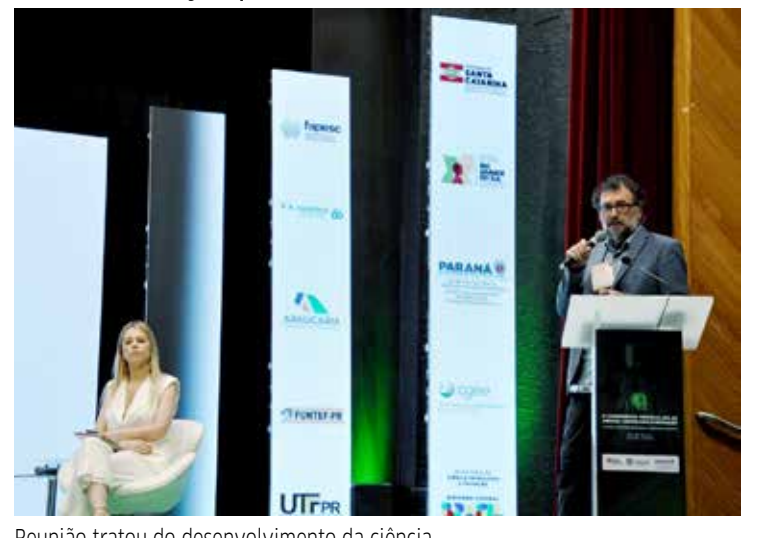
Reunião tratou do desenvolvimento da ciência