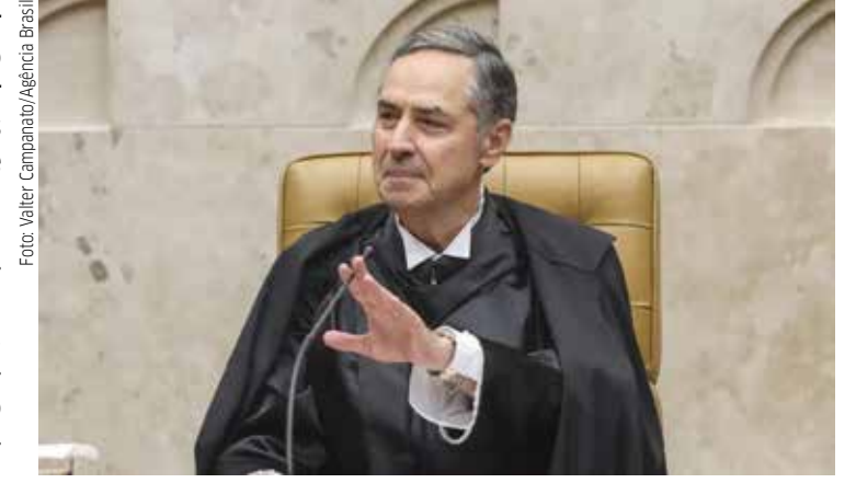
Luís Roberto Barroso: "Consumo de maconha continua a ser considerado ilícito"

"Eu não acho que ele não tem a informação correta, a informação é essa mesmo. A grande ver-