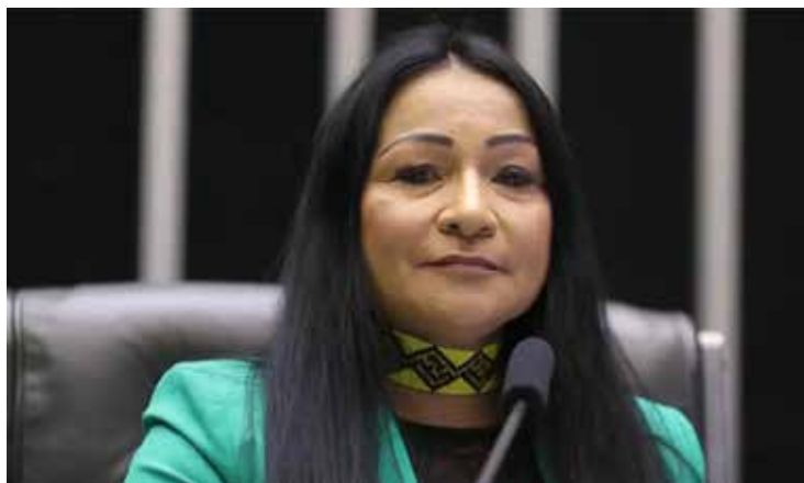
Silvia Waiäpi comandou a Secretaria Especial de Saúde Indígena (Sesai) no governo de Jair Bolsonaro

Em 2023, o nome da deputada foi incluído em inquérito que apura os atos que resultaram na invasão do Palácio do Planalto, do Congresso Nacional e do Supremo Tribunal Federal (STF) em 8 de janeiro de 2023.