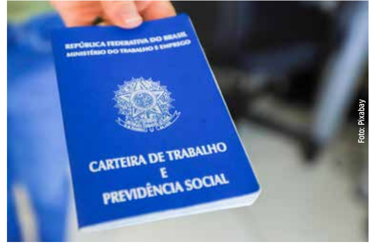
Números mostram expectativa de contratações

A Pesquisa de Expectativa de Emprego - Q4 2024, estudo exclusivo e preditivo desenvolvido trimestralmente pelo ManpowerGroup, líder global em soluções de força de trabalho, revelou que 43% das empresas pretendem contratar no 4º trimestre de 2024.