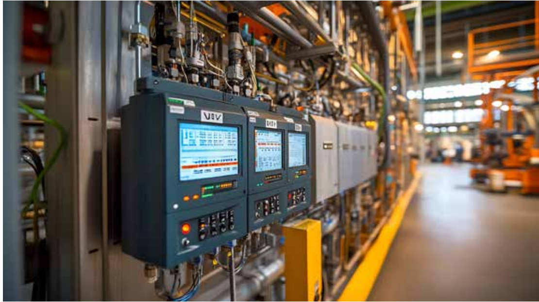
Eficiência energética e produção estão em debate

De acordo com uma pesquisa da CNI, as instalações industriais brasileiras possuem, em média, 14 anos de idade. Anualmente, esses equipamentos e maquinários consomem aproximadamente R$ 90 bilhões em eletricidade e combustíveis. Por isso, a implementação de medidas de eficiência energética é considerada a estratégia mais eficaz para reduzir custos com energia, além de ser uma solução acessível para a redução das emissões de gases de efeito estufa (GEE). No entanto, devido à falta de conhecimento, muitas empresas deixam de adotar essas práticas, perdendo