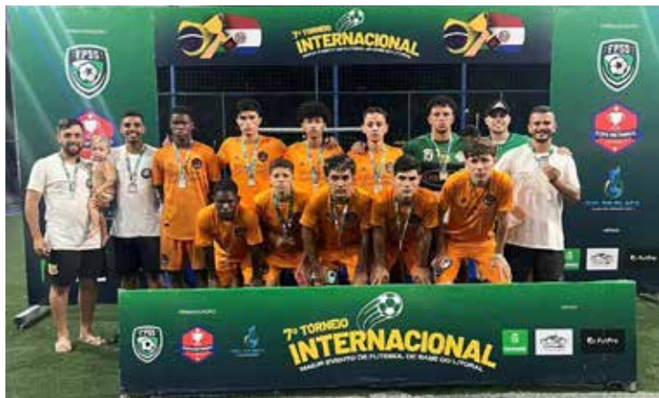
Time fez campanha com três vitórias e dois empates