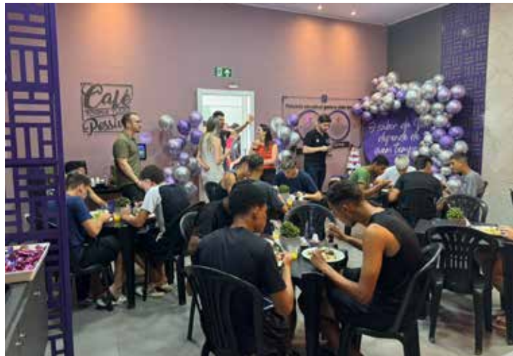
Instalação do restaurante visa oferecer alimentação balanceada aos atletas

O Atlético Clube Paranavaí (ACP) SAF inaugurou nesta segunda-feira (10) um restaurante que atenderá jogadores, comissão técnica e demais colaboradores do clube. O novo espaço fica nas dependências do centro de treinamento do clube, na antiga Associação de Moradores do Ouro Branco.