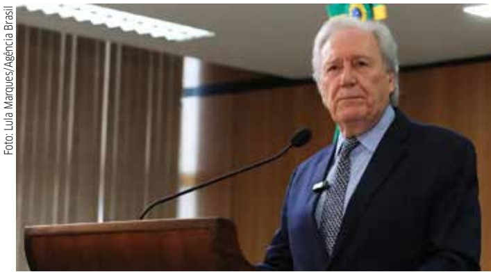
Ministro da Justiça e Segurança Pública, Ricardo Lewandowski, apresenta nova versão da PEC da Segurança Pública no Ministério da Justiça

Com a proposta, o governo federal pretende dar status cons-