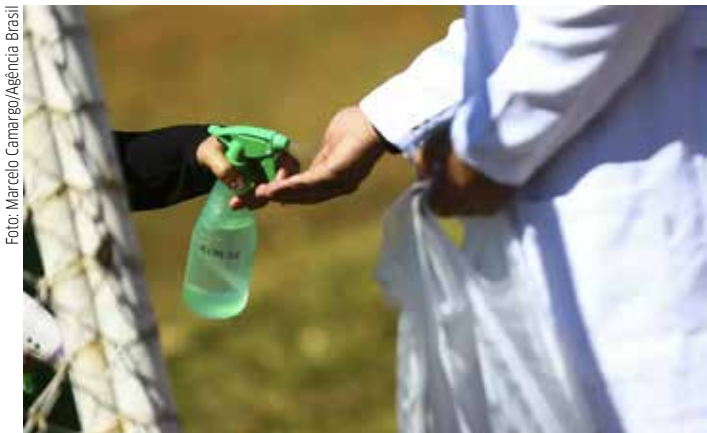
Imagem mostra médicos chegando ao local de prova para a segunda etapa Revalida de 2020.

O Revalida aborda, de forma interdisciplinar, as cinco grandes