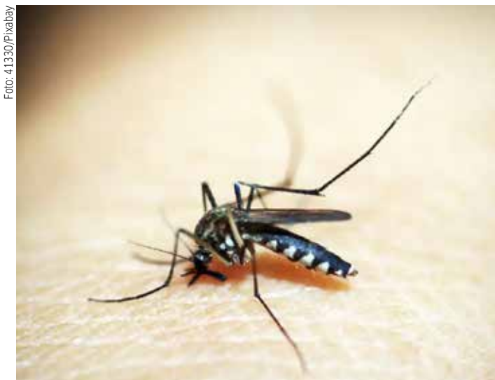
Paraná é o terceiro estado com maior número de casos prováveis de dengue

São Paulo lidera o ranking de estados, com 291.423 casos prováveis. Em seguida estão Minas Gerais (57.348), Paraná (31.786) e Goiás (27.081). Em relação ao coeficiente de incidência, o Acre aparece em primeiro lugar, com 760,9 casos para cada 100 mil habitantes, seguido por São Paulo (633,9), Mato Grosso (470,2) e Goiás (368,4).