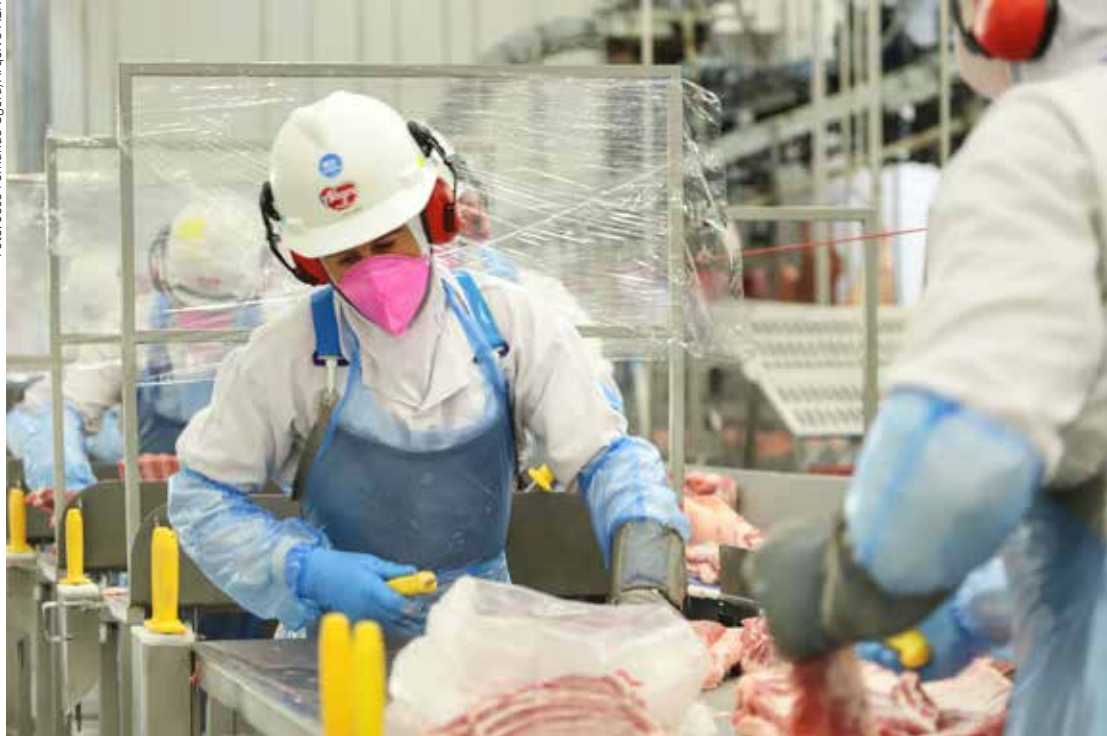
Carne suína, de frango e automóveis: exportações do Paraná saltam em 2025

A maior alta na comparação entre os primeiros trimestres de 2024 e de 2025, porém, foi na exportação de automóveis, setor