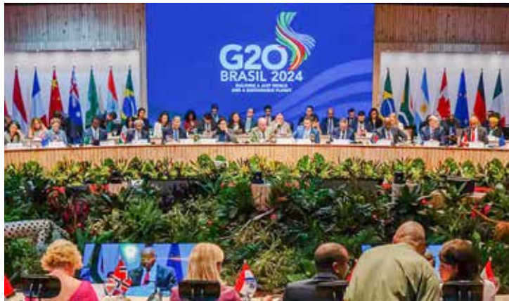
Reunião de líderes mundiais no Brasil

Os investimentos nacionais, conforme ressaltou o ministro, têm avançado, mas ainda estão aquém do necessário. O novo PAC vai investir, até 2026, US$ 330 milhões na gestão de