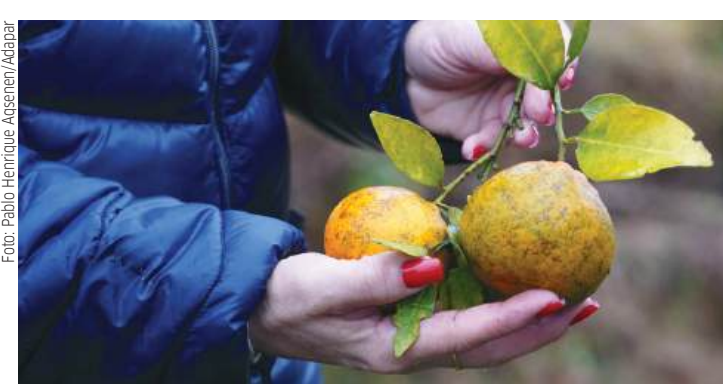
Citricultura é um dos segmentos econômicos relevantes do Paraná

Ações da Adapar - A metodologia e a realização da fiscalização são de competência do órgão. A autarquia também atua em municípios que não tenham registro da ocorrência do Greening sendo responsável por levantamentos fitossanitários em imóveis com plantações de citros, comerciais ou não, e em viveiros e comércios de mudas. Em caso da constatação da praga nesses municípios, a Adapar será res-