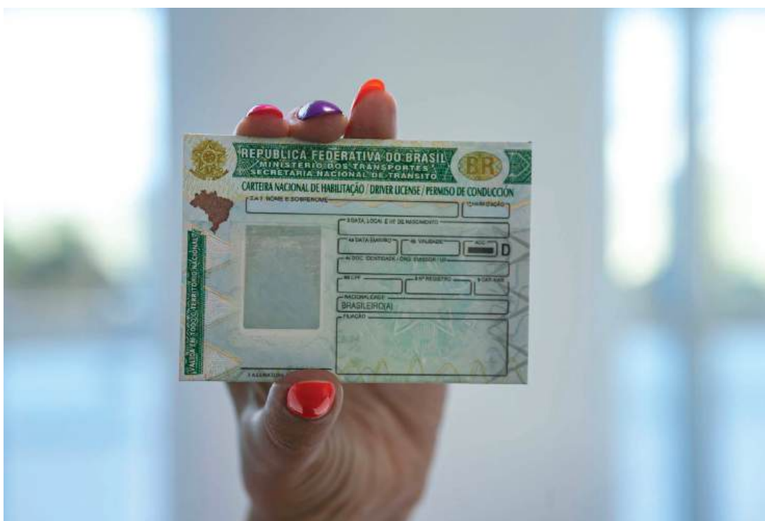
Inscrições para o primeiro edital da CNH Social encerram na segunda-feira

Como funciona – O programa foi estabelecido por lei