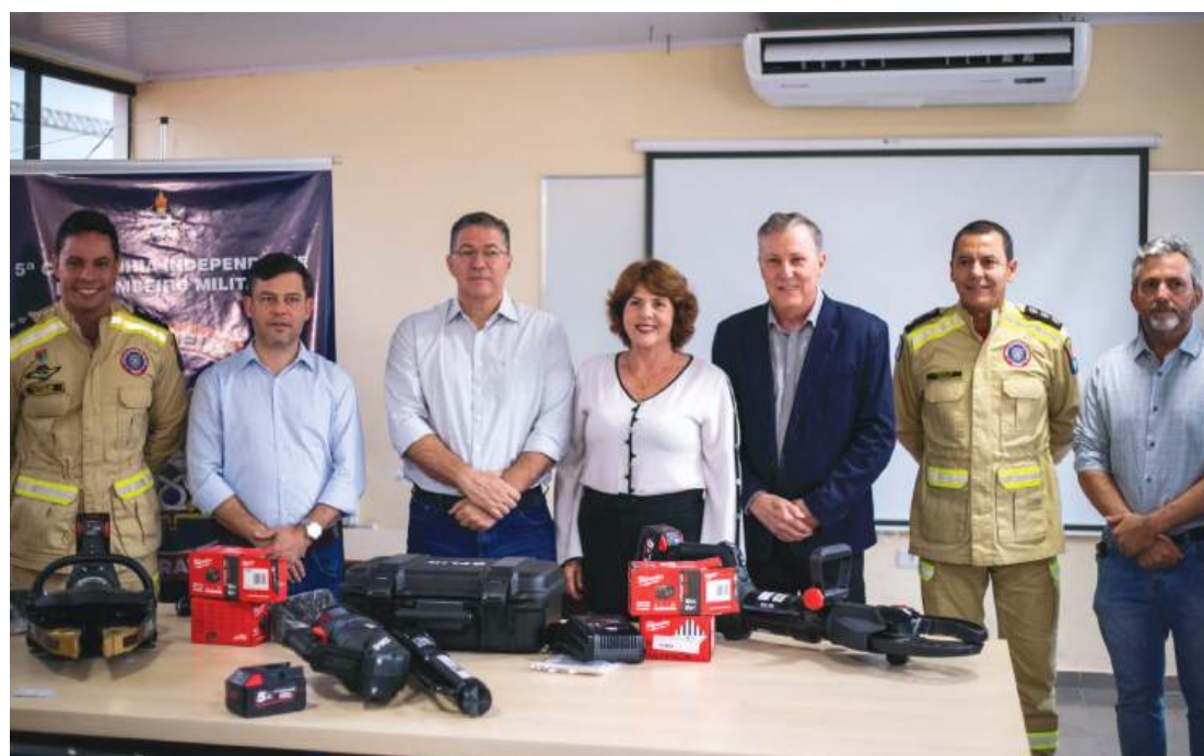
Equipamentos foram entregues nesta quinta-feira

O Selo de Baixo Risco identifica atividades econômicas com menor potencial de causar danos à saúde ou ao meio ambiente. Empresas enquadradas nessa categoria ficam dispensadas da emissão de licenças de órgãos como Corpo de Bombeiros, Vigilância Sanitária, Meio Ambiente e Defesa Agropecuária, o que reduz etapas burocráticas e acelera o início das atividades.