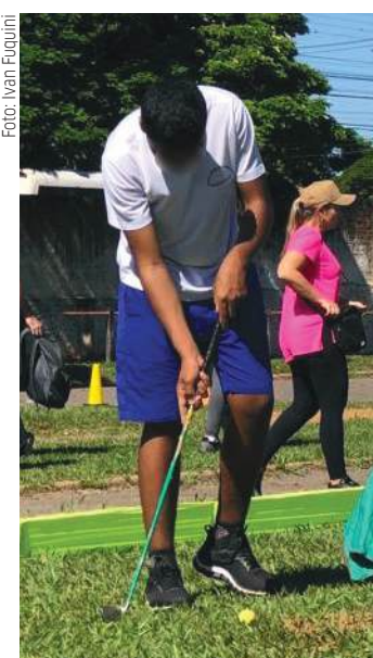
Festival deve receber participantes de 24 municípios

Na segunda-feira (16) e terça-feira (17) Paranavaí receberá o Festival Paradesportivo na pista de atletismo do Colégio Estadual de Paranavaí. O evento é uma iniciativa do Governo do Estado, em parceria com os escritórios regionais da pasta, Unespar e projeto de Atletismo de Paranavaí. A expectativa é de que o festival receba participantes de 24 municípios. No primeiro dia será realizada uma capacitação técnica de bocha paralímpica, que tem início programado para as 13h. Já, no segundo dia ocorrem as competições nas modalidades de bocha paralímpica, golf-7 e atletismo.