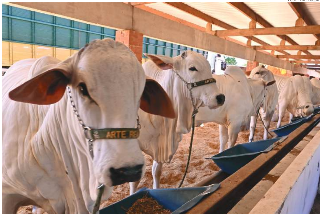
A edição do julgamento na ExpoParanavaí reúne os melhores exemplares do país