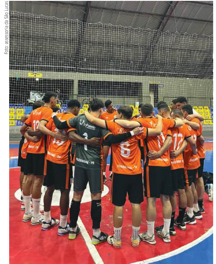
São Lucas encerrou a preparação na quinta-feira (12)