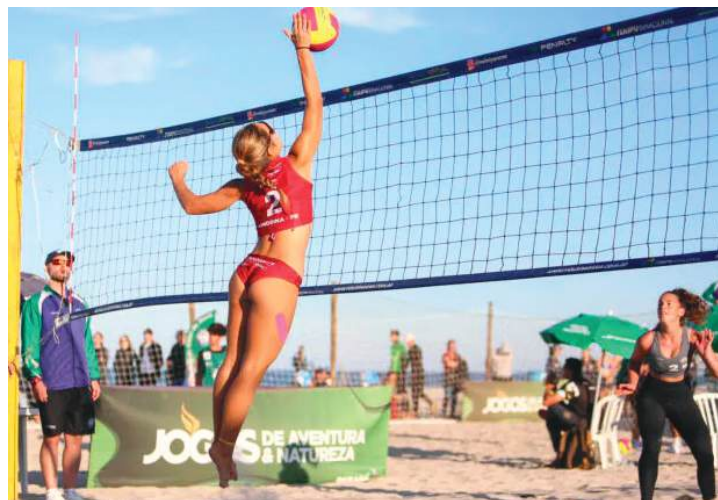
Etapa segue até domingo em Matinhos

distribuídas em seis quadras funcionando simultaneamente. A etapa marca a continuidade da temporada estadual do vôlei de praia, que começou com a Etapa Challenger, realizada simultaneamente nos municípios de Paranguá, Campo Mourão, Manoel Ribas e Marechal Cândido Rondon. A iniciativa ampliou o alcance da competição, incentivando novos polos regionais e fortalecendo a base da modalidade no Paraná. Além do aspecto esportivo, a competição também integra o calendário dos Jogos de Aventura e Natureza, programa do Governo do Estado que utiliza o esporte como ferramenta de desenvolvimento turístico e econômico, especialmente em períodos fora da alta temporada. Para o diretor de Inovação e Desenvolvimento da Secretaria de Estado do Esporte, Tiago Campos, a realização do circuito no litoral reforça o papel do esporte como indutor do movimento econômico e valorização das potencialidades naturais do