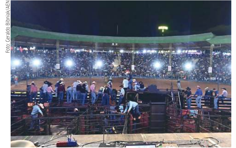
Rodeio, uma das grandes atrações, teve a final realizada na quinta-feira

Conhecido por sucessos românticos e pela forte presença de palco, Eduardo Costa construiu uma carreira consolidada no cenário sertanejo, com músicas que marcaram diferentes fases do gênero e conquistaram milhões de fãs em todo o Brasil. A apresentação é uma das mais aguardadas da programação musical da ExpoParanavaí e deve atrair um grande público ao parque.