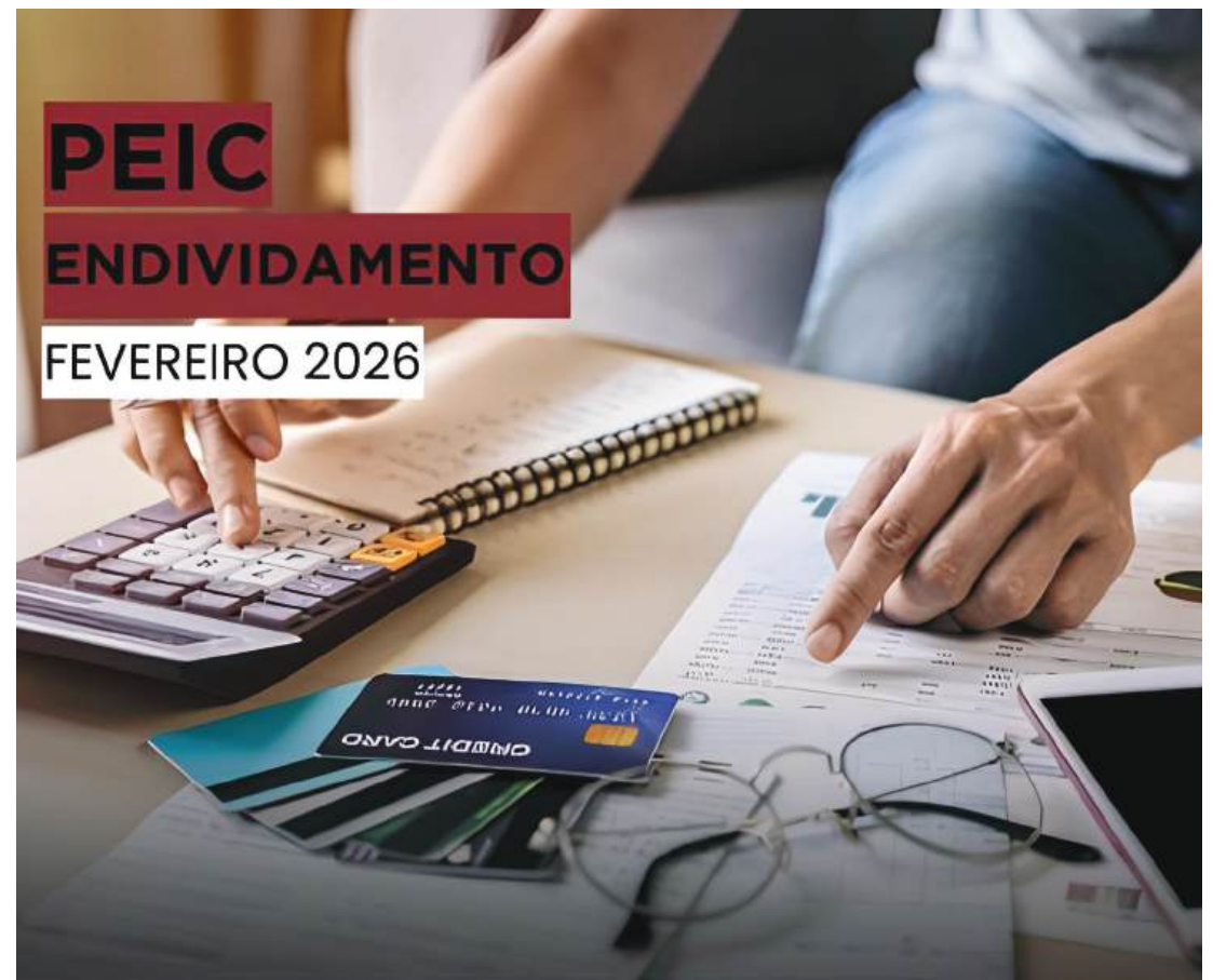
Números mostram redução do endividamento no Paraná

Tipos de dívida - O levantamento também aponta quais são os principais compromissos financeiros das famílias paranaenses. O cartão de crédito permanece como a modalidade de dívida mais comum, citado por 94,8% dos entrevistados. Em seguida aparecem o financiamento de veículos (7,4%), o financiamento imobiliário (7%) e os carnês (4,9%).