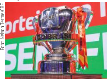
Copa do Brasil é um dos troféus mais cobiçados do País

Times da série a entram na próxima fase - Os 20 clubes da elite se juntarão aos 12 classificados da quarta fase, e os confrontos serão definidos por sorteio. As partidas serão em jogos de ida e volta e acontecerão entre os dias 22 e 23 de abril (ida) e 13 e 14 de maio (volta). Os times que já estão garantidos na 5ª fase: Flamengo, Fluminense, Vasco, Botafogo, Palmeiras, Corinthians, São Paulo, Santos, Bragantino, Mirasol, Atlético-MG, Cruzeiro, Internacional, Grêmio, Athletico-PR, Coritiba, Bahia, Vitória, Remo e Chapecoense.