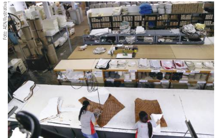
Levantamento mostra crescimento no número de empresas

O programa atua em três frentes principais: a liberação mais rápida do CNPJ e autorizações para empresas de baixo risco, que podem ser concluídas em menos de 24 horas, a criação de soluções para simplificar o fechamento de empresas e a atuação de um comitê permanente de desburocratização com parti-