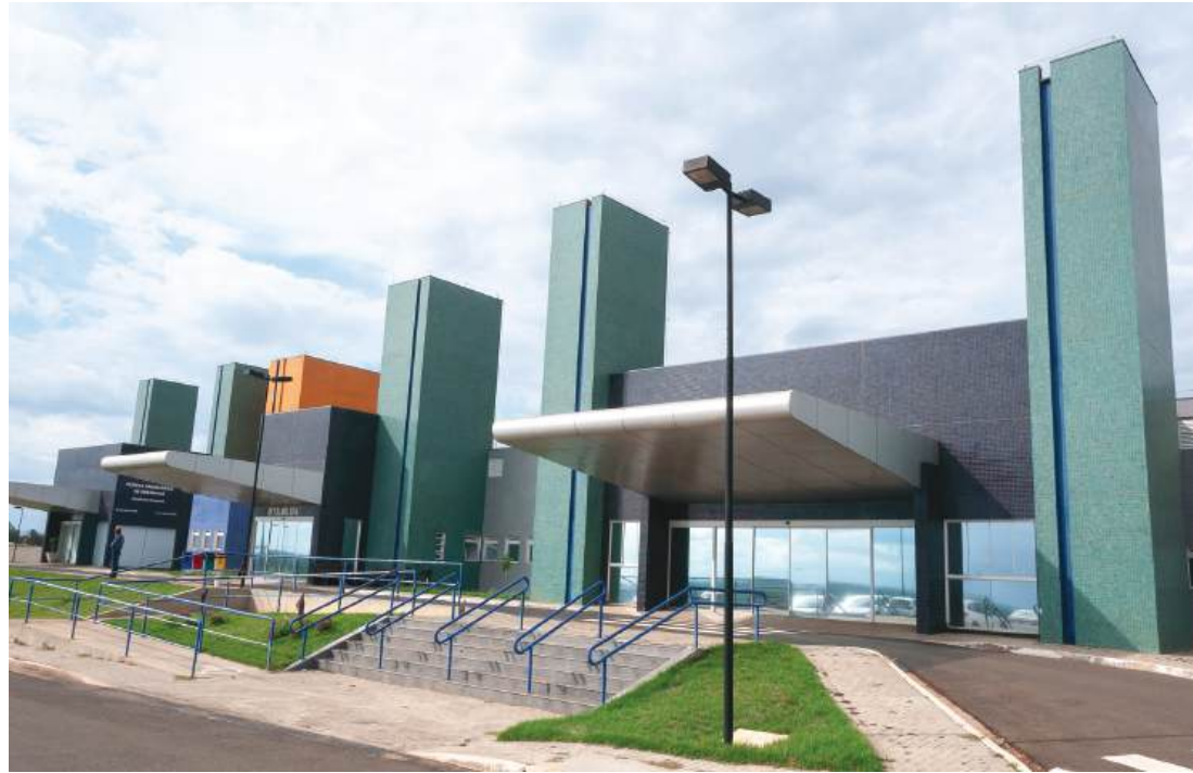
Expectativa é que os novos leitos de UTI passem a funcionar ainda neste ano