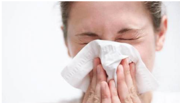
Números foram divulgados pela Secretaria de Saúde

Com a proximidade do outono, que começa em 20 de março, a Secretaria da Saúde reforça a importância das medidas de prevenção contra doenças respiratórias. A queda das temperaturas e a maior permanência das pessoas em ambientes fechados favorecem a circulação de vírus, aumentando o risco de transmissão