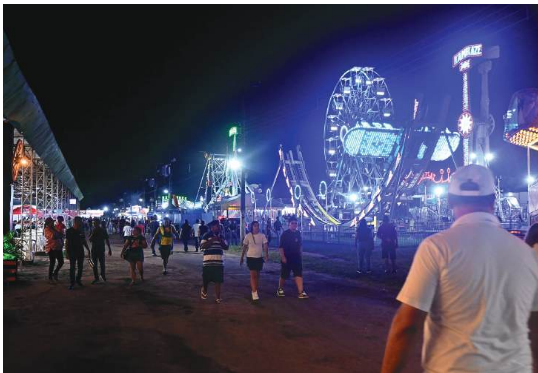
ExpoParanavaí é uma das festas mais tradicionais do Paraná

Para muitos visitantes, o último fim de semana é também a oportunidade de aproveitar as atrações finais, conhecer novidades do setor agropecuário e celebrar uma das tradições mais importantes da região Noroeste do Paraná.