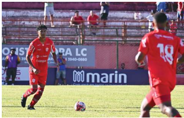
ACP enfrenta Paraná Clube fora de casa

O Atlético Clube Paranaense (ACP), que ainda não pontou na Série B do Paranaense de Futebol, tentará sua primeira vitória na competição contra o Paraná Clube. A partida válida pela terceira rodada está marcada para as 15h30, na Vila Capanema, em Curitiba. O ACP perdeu as duas primeiras na Série B e ocupa a 8ª posição nessa primeira fase. Já o Paraná Clube venceu seus primeiros compro-