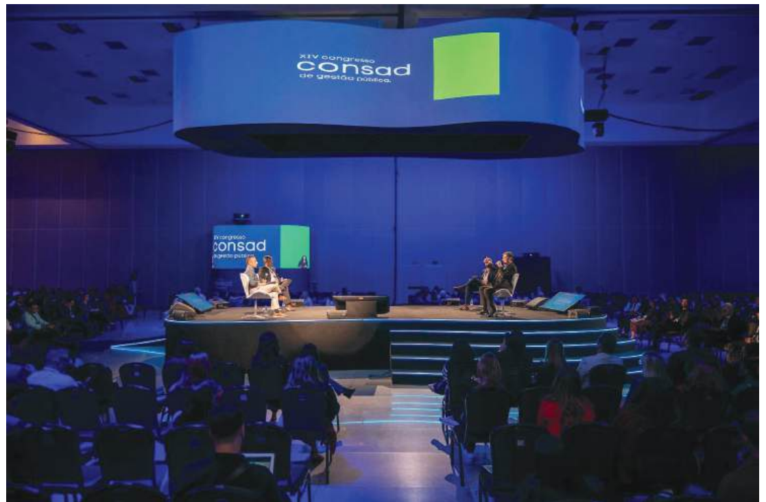
A expectativa da organização é receber mais de 3 mil participantes

O Paraná tem cinco trabalhos indicados no 15º Congresso do Conselho Nacional de Secretários de Estado da Administração (Consad), o maior evento da área no País. A edição deste ano acontece em Fortaleza (CE) a partir desta quarta-feira (20), até a próxima sexta-feira (22).