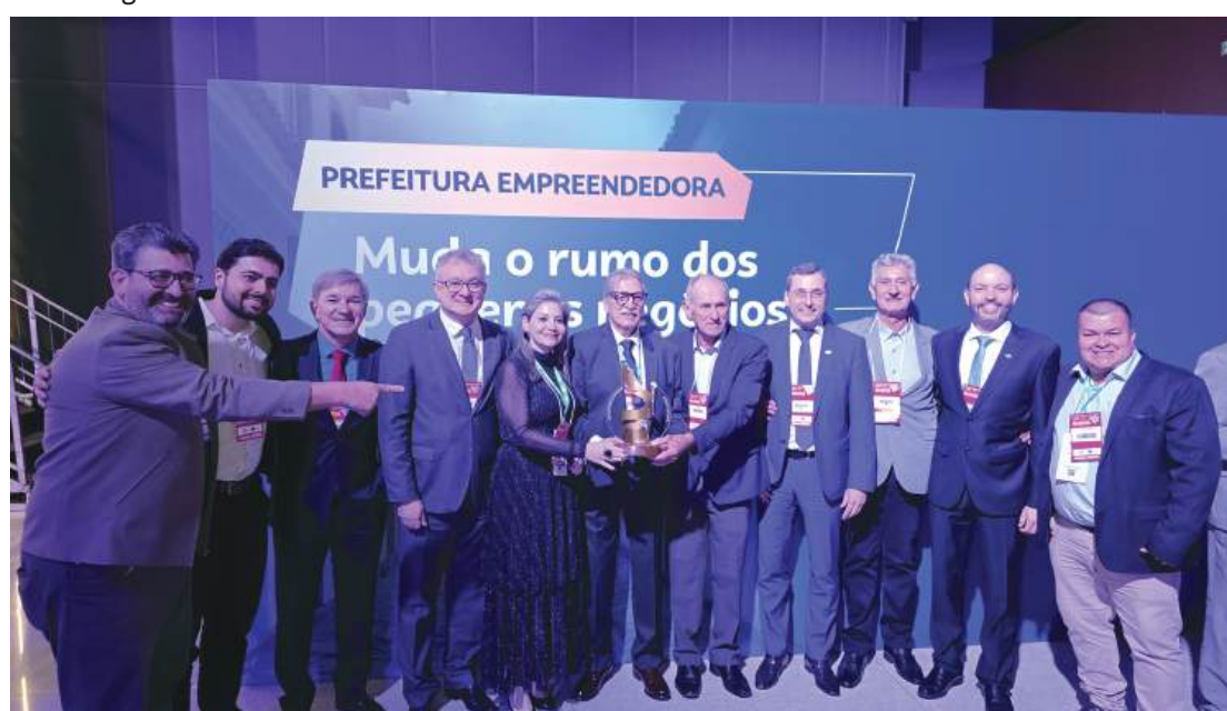
Premiação mobilizou lideranças nesta segunda-feira

A premiação completa está disponível no YouTube do Sebrae.