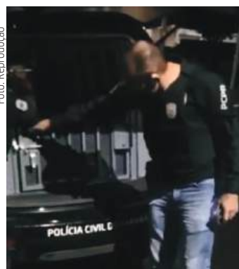
Polícia confirmou a prisão temporária da jovem

A polícia não detalhou como teriam ocorrido as movimentações bancárias e informou que o caso segue sob sigilo. As investigações continuam, tanto para localizar as jovens quanto para prender o homem apontado como principal suspeito. Nas últimas atualizações da PCPR, imagens de segurança mostraram as primas em uma festa em Paranavaí, acompanhadas pelo homem. Por conta da proximidade, buscas chegaram a ser realizadas em estradas rurais da cidade, mas nada foi encontrado. A Polícia Civil reforça que a população pode colaborar com informações de forma anônima pelos telefones 181, 197 e 190, ou diretamente nas unidades policiais, especialmente na Subdivisão Policial de Cianorte.