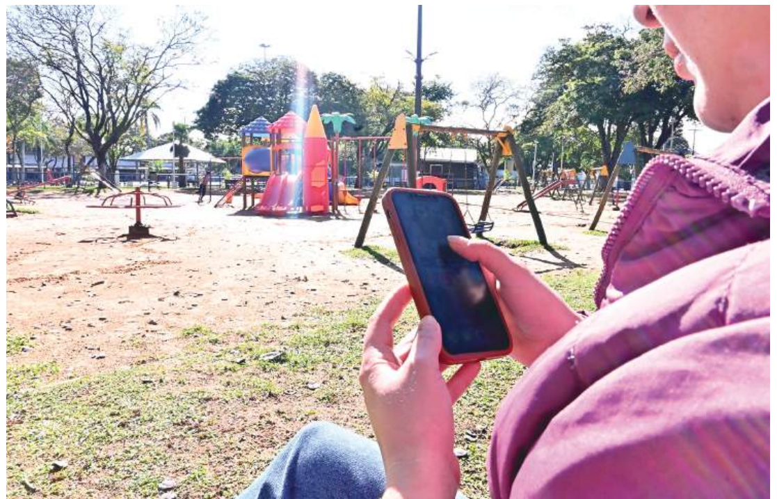
Novo serviço será disponibilizado na Praça dos Pioneiros

O período das inscrições será de 18 de maio de 2026 a 17 de junho de 2026.