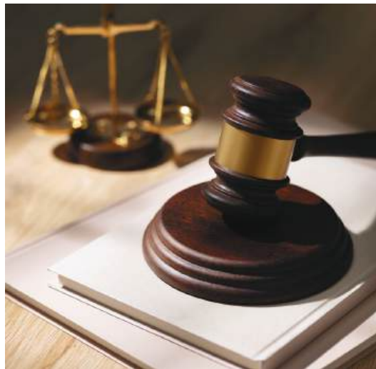
Prazo para inscrição termina nesta quarta-feira

No ano passado, a Semana Nacional da Conciliação Trabalhista atendeu 472 mil pessoas em todo o