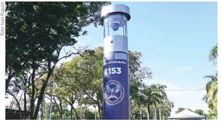
Prefeitura de Paranavaí contratou 10 totens de segurança, em regime de locação, e investe cerca de R$ 180 mil mensalmente

Cabe destacar que o município contratou 10 totens de segurança, em formato de locação, e instalou os equipamentos em diferentes pontos da cidade, considerados pela gestão como estratégicos para o combate à criminalidade. O investimento público é