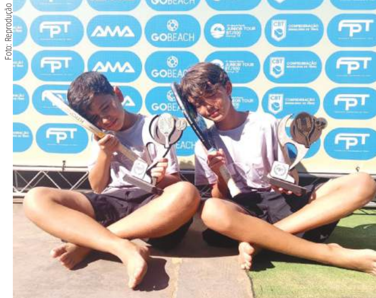
Dupla ainda sonha em disputar a Copa das Confederações

Mesmo com os resultados positivos, os atletas ainda enfrentam dificuldades para disputar todas as etapas nacionais por conta dos altos custos