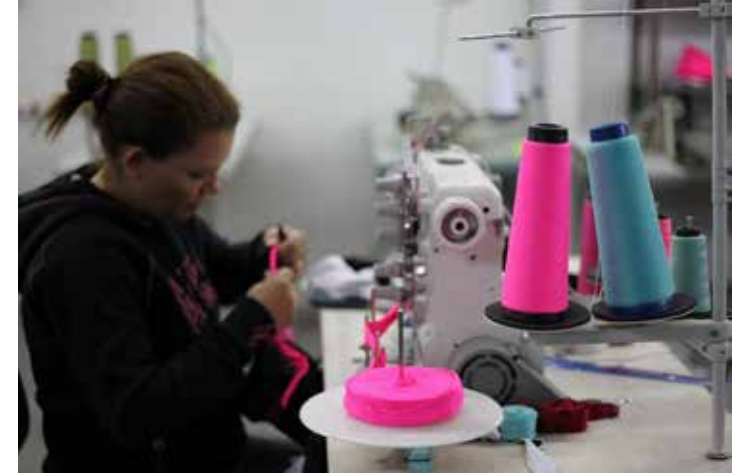
No ano, o setor de confecções e vestuário se destaca em criação de novas vagas

Dos 10 mil postos de trabalho abertos no Paraná em abril, 4.074 foram oportunidades criadas pela indústria do estado. Os números do Novo Cadastro Geral de Empregados e Desempregados (Novo Caged) foram divulgados nesta terça-feira (26) e revelam que novamente a indústria tem liderado o ranking de vagas no mercado de trabalho paranaense.