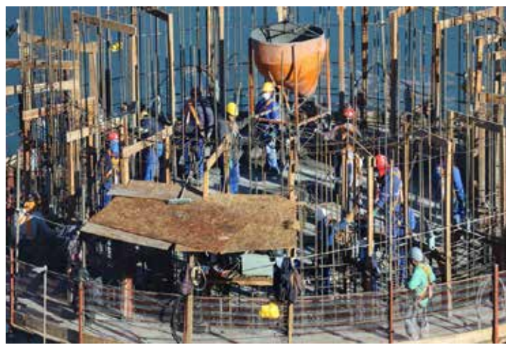
Números do Caged foram divulgados nesta terça-feira

Setores - O saldo de empregos no Estado em abril foi puxado pela indústria, que gerou 4.074 vagas no último mês. Foi seguida pelo comércio, com 2.888 novos postos de trabalho, setor de construção (2.014), a agropecuária e produção florestal (1.078).