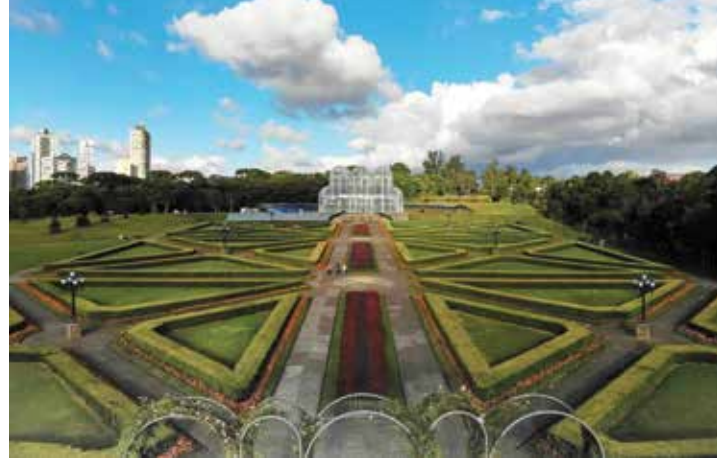
Paraná se destaca quando o tema é turismo no país

De acordo com o site Booking, 59% dos entrevistados pretendem ir para um destino de natureza próximo. Ainda segundo o buscador, outra forte tendência é a opção por viagens rápidas, ou seja, três em cada quatro (73%) brasileiros querem fa-