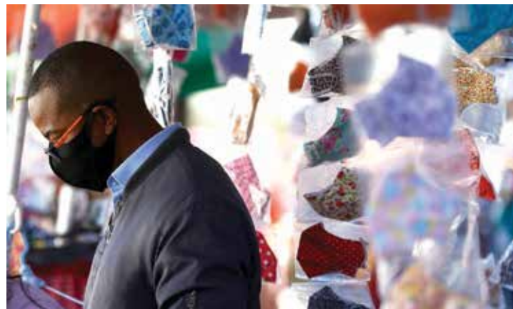
Máscaras se tornaram item obrigatório de proteção em tempos de pandemia

Item que se tornou essencial na vida de todos para diminuir o contágio pelo novo coronavírus também pode prejudicar o meio ambiente, caso seja descartado de forma incorreta. Após quase um ano de pandemia, estima-se que o Brasil possa descartar mais de 12,7 bilhões de máscaras de tecido, levando em conta que cada uma delas pode ser lavada até 30 vezes e que um brasileiro possui, em média, cinco delas.